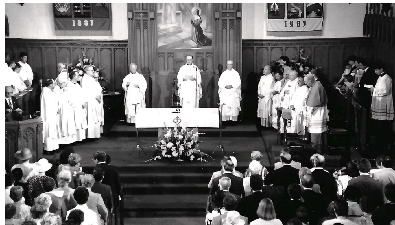
Messe solennelle célébrée à l'occasion du centenaire de la paroisse, le 24 juin 1987.

The Canadians are delighted. I told them that I thought a priest could support himself in Toronto respectably for 600.00 per year, and his casual. Things are dear in the city. The committee will send, as soon as possible, 200.00 to your Grace, as the first instalment of the priest's salary. We shall most willingly give hospitality to the priest till he can provide for himself.