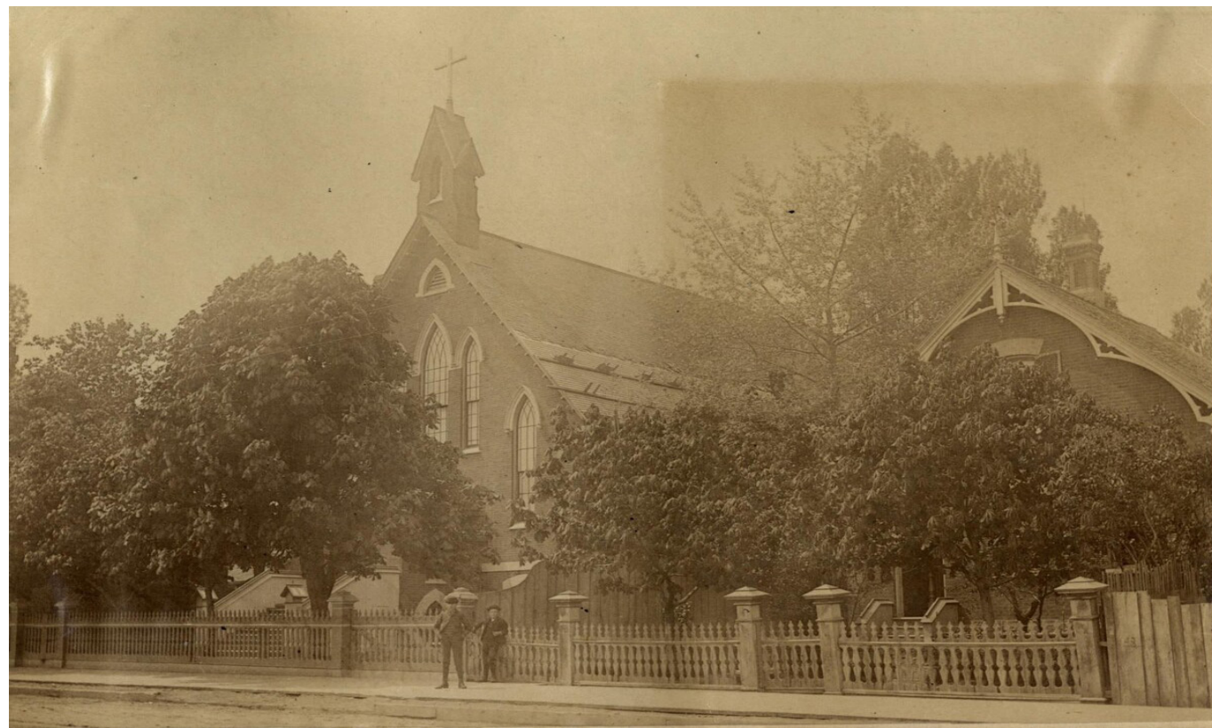
La East Presbyterian Church à l'angle des rues King et Sackville, dans les années 1880. Elle est devenue l'église du Sacré-Coeur en 1888.

Dans les années 1880, un groupe de familles canadiennes françaises vint s'installer à Toronto. Ces Canadiens français venaient de Montréal; c'était des travailleurs de cuir et justement une compagnie de cuir leur offrait du travail. Ils ont apprécié le travail qui leur était offert, mais vite ils se sont sentis isolés dans cette grande ville anglophone de Toronto à grande majorité protestante. Il leur manquait quelque chose qui leur était si cher; une communauté chrétienne bien à eux où ils pourraient prier en leur langue, où ils pourraient chanter leurs cantiques traditionnels en français.