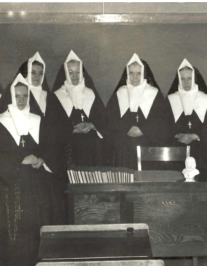
Sœurs de l'École du Sacré-Cœur

Monseigneur. Il chante sa première messe le dimanche 20 mars. Une célébration est également organisée à son intention dans la salle paroissiale le soir même.